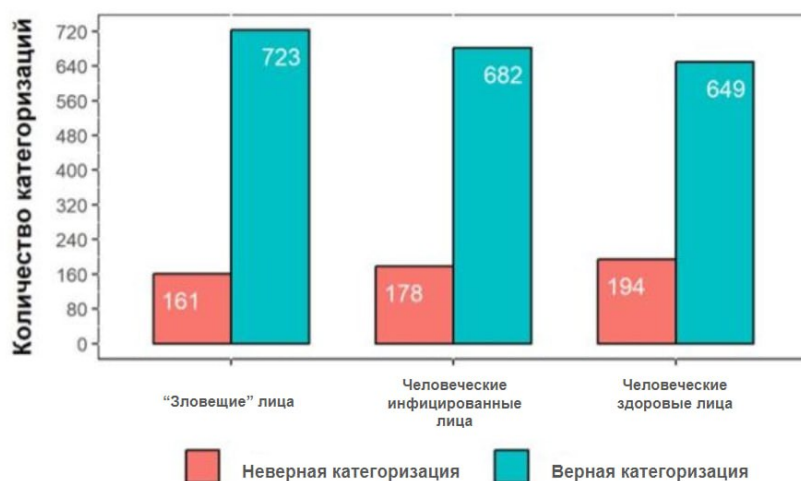
Рис. 2 Показатели точности категоризации для «зловещих», инфицированных и здоровых лиц