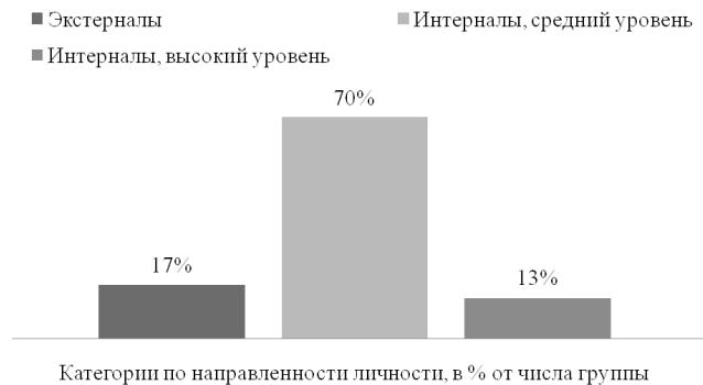
Рис. 2. Представленность категорий экстернальности и интернальности у беременных женщин (n = 23)

дальнейшего поведения. Уровень интернальности отражает самодостаточность женщины в этом положении, ограничение ее социальных связей, выстраивание новой иерархии отношений. Показательно, что уровень интернальности как показатель сосредоточенности на себе может быть связан и с непредсказуемостью развития дальнейших событий, то есть ощущением неуверенности женщин в себе и своем положении.