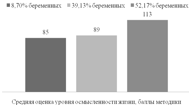
Рис. 1. Распределение группы опрошенных беременных женщин по уровням осмысленности их жизни (n = 23)

Из всех испытуемых 52,17 % будущих матерей имеют высокий показатель осмысленности жизни, у 39,13 % – средний показатель и 8,7 % – низкий. Такие данные свидетельствуют, что большинство опрошенных женщин имеют в будущем цели, связанные с ожиданием рождения ребенка, обеспечением условий его существования и развития, стратегией совместной жизни и готовность к опеке.