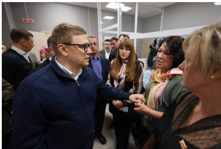
Рисунок 3. Нарратив «стабильность». Паблик в ВКонтакте А. Л. Текслера. Пост от 11.10.2023 г. (15:40) 4 .