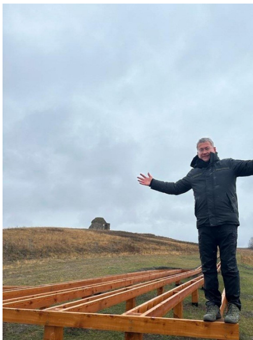
Рисунок 2. Нарратив «путь героя». Паблик в ВКонтакте Р. Ф. Хабирова. Пост от 21.10.2023 г. (14:14) 3 .