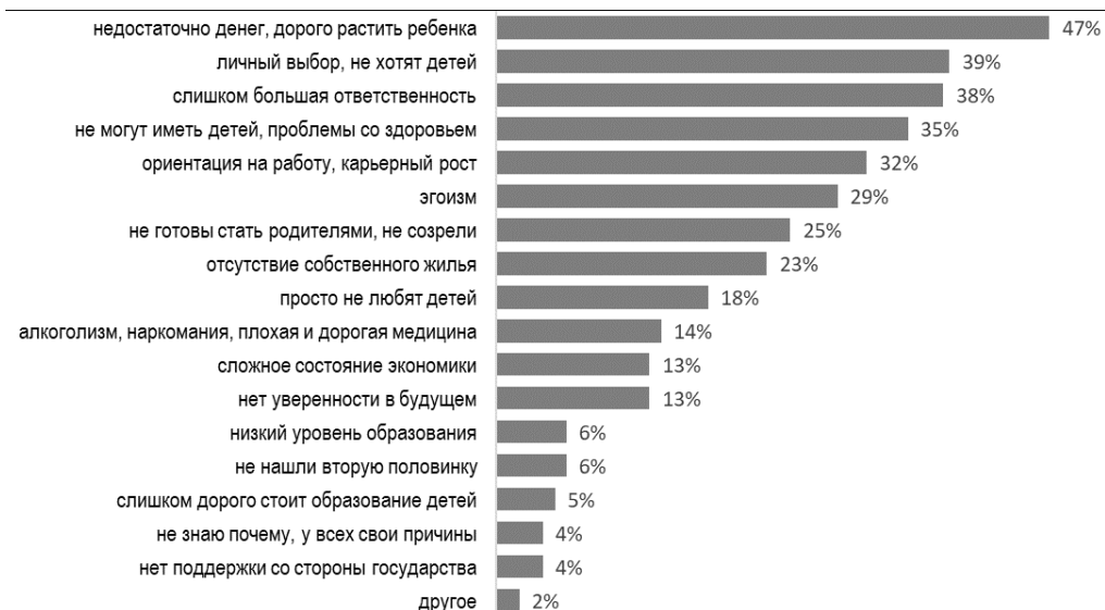
Рисунок 2. Распределение ответов на вопрос «Как вы думаете, почему люди принимают решение не заводить детей?».

Главной причиной, заставляющей молодых людей откладывать рождение ребенка или совсем отказаться от появления детей в семье, по мнению респондентов, является нехватка денег (47,5 %). Кроме того, в числе причин личный выбор, нежелание иметь детей – 38,5 %; боязнь ответственности – 38 %; проблемы со здоровьем – 35 %; ориентация на работу, карьерный рост – 31,5 % (рис. 2).