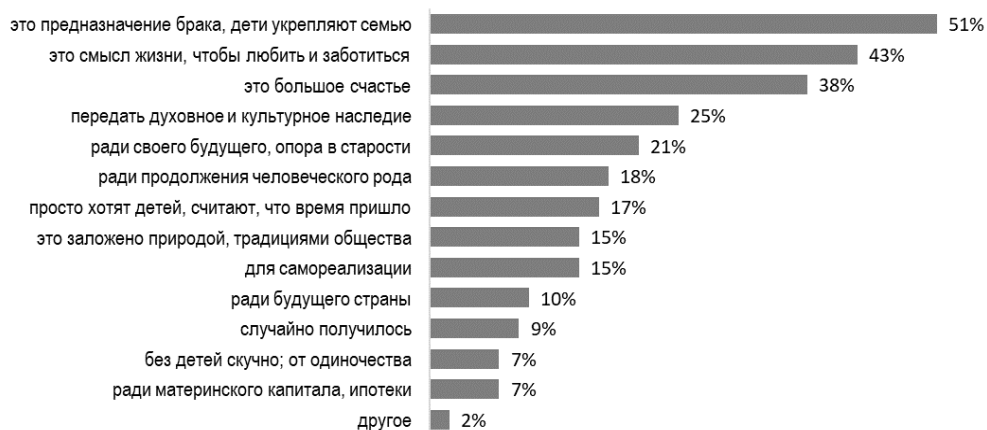
Рисунок 1. Распределение ответов на вопрос «Как вы думаете, для чего заводят детей?».

Главной причиной, заставляющей молодых людей откладывать рождение ребенка или совсем отказаться от появления детей в семье, по мнению респондентов, является нехватка денег (47,5 %). Кроме того, в числе причин личный выбор, нежелание иметь детей – 38,5 %; боязнь ответственности – 38 %; проблемы со здоровьем – 35 %; ориентация на работу, карьерный рост – 31,5 % (рис. 2).