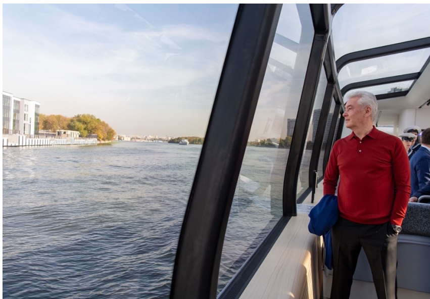
Рисунок 1. Нарратив «путь героя». Паблик в ВКонтakte С. С. Собянина. Пост от 29.09.2023 г. (14:18) 2 .

Говоря о выделенных нами четырех основных нарративах, важно подчеркнуть, что они объединяют в себе большое количество сюжетных вариаций более узких тематик, в зависимости от происходящих в том или ином регионе событий и существующих практик (можно предположить, что они носят универсальный характер). Более мелкое дробление в рамках исследования, на наш взгляд, способствовало бы разобщению полученного материала и концентрации сугубо на новостной повестке. В то же время идея с доминирующими нарративами является одной из наиболее актуальных в изучении сторителлинга.