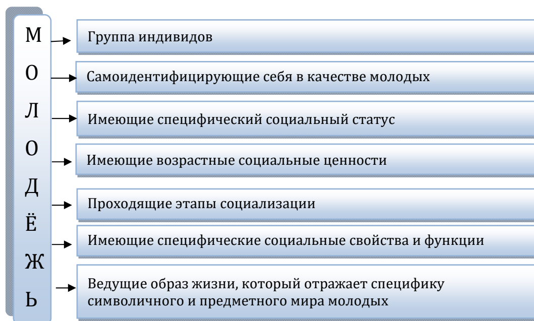
Рисунок 1. Основные характеристики категории «молодёжь»

В своем анализе мы будем исходить из определения молодежи, предлагаемого В. А. Луковым. Итак, молодежь является социальной группой, состоящей из индивидов, которые осваивают и присваивают социальную субъектность, имеющих социальный статус молодых и являющихся молодыми по самоидентификации, кроме того распространенные в этой социальной группе тезаурусы выражают и отражают специфику символического и предметного мира молодежи [3, с. 13].