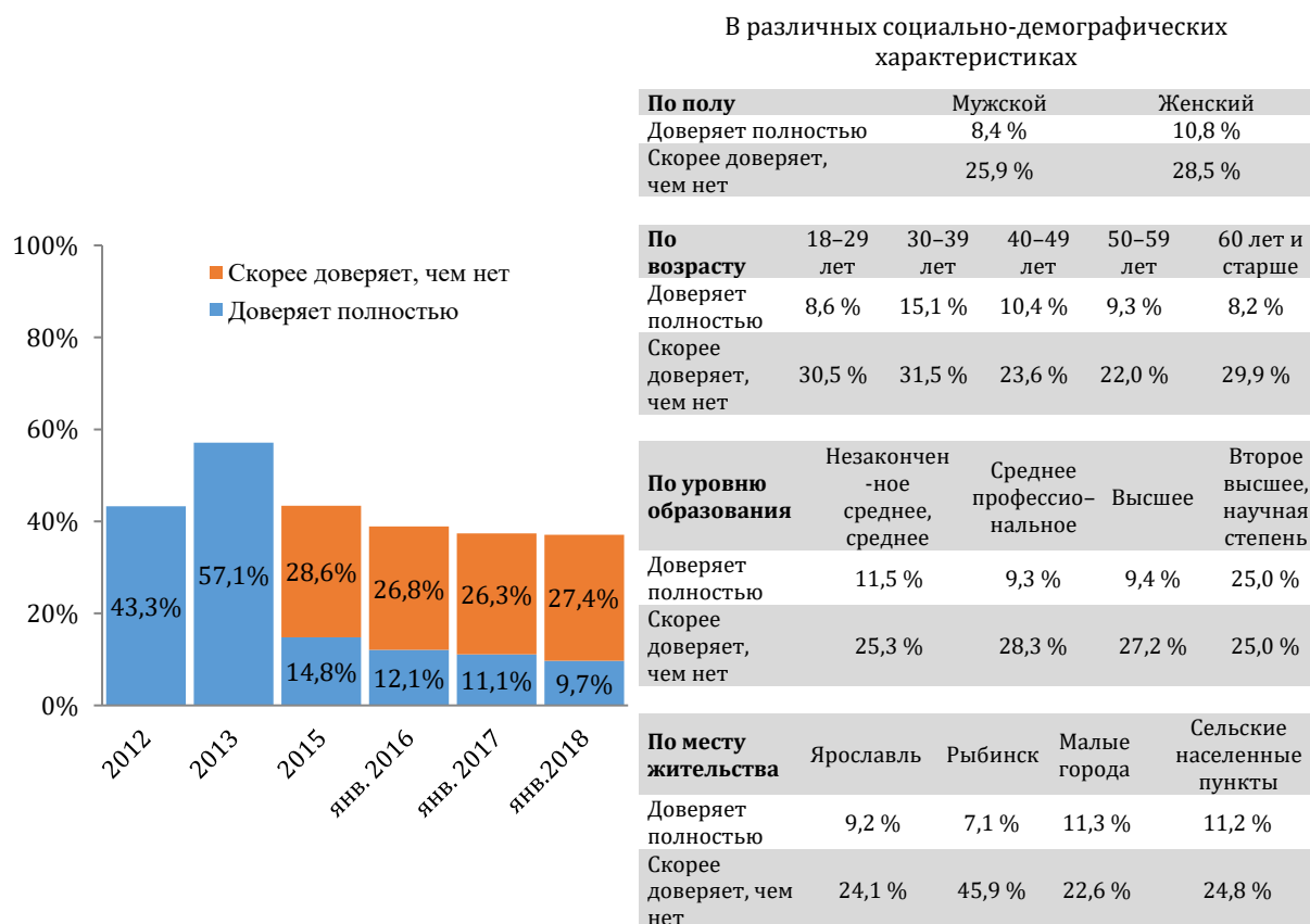
Диаграмма 1. Уровень доверия населения к деятельности НКО.

свидетельствует о значительном влиянии институциональной среды (диаграмма 1). Однако темпы снижения в 2017 г. замедлились, показатель доверия стабилизировался на уровне 37 %, а в 2015 г. он был на уровне 43,4 %. Доля респондентов, не испытывающих доверия по отношению к третьему сектору, к январю 2018 г. составила 44,9 %, в 2017 г. их было 42,6 %, в 2016 г. – 30,7 %. Можно ожидать, что в будущем произойдет перелом ситуации.