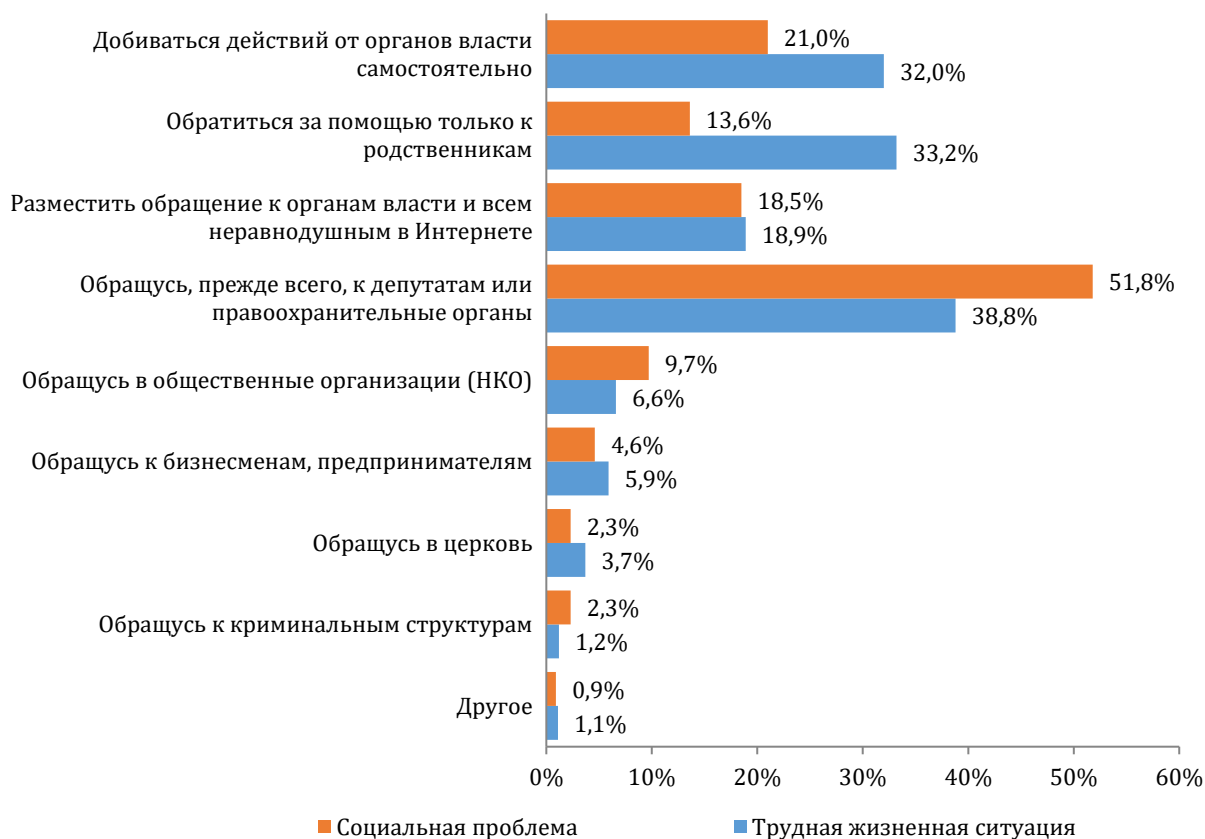
Диаграмма 4. Распределение ответов участников массового опроса на вопрос: «Какой способ Вы считаете наиболее эффективным при необходимости решить социальную проблему, затрагивающую интересы многих граждан (обустройство двора, ремонт дорог и пр.)? А какой способ Вы считаете наиболее эффективным при необходимости донести до органов власти информацию о своей сложной жизненной ситуации либо побудить их к исполнению своих непосредственных обязанностей (до 3-х вариантов ответов)?»

Согласно результатам количественного опроса, обращение к депутатам или в правоохранительные органы – наиболее эффективные, по мнению жителей области, способы информирования представителей власти о сложной жизненной ситуации или социальных проблемах (51,8 % и 38,5 % соответственно). Несколько меньше тех, кто признает результативность самостоятельных действий (21,0 % и 32,0 % соответственно).