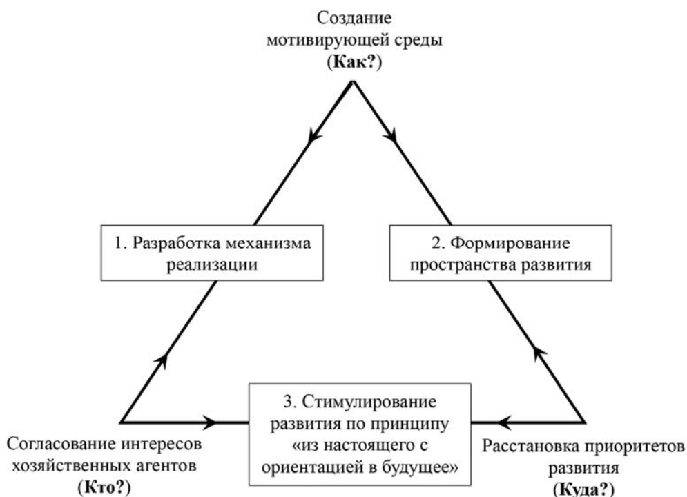
Рисунок 2. Содержание институционального треугольника территориального развития.