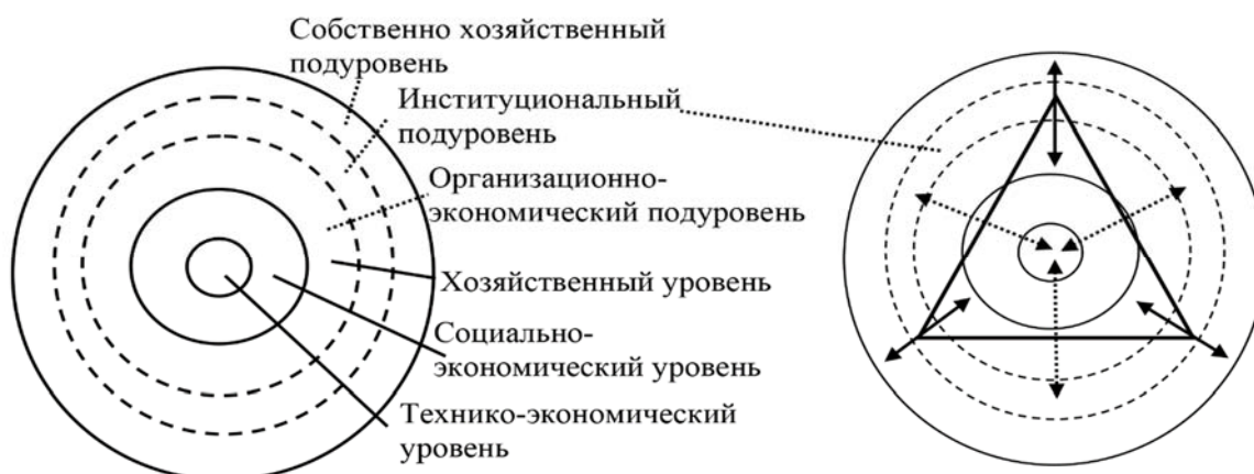
Рисунок 1. Хозяйственная система (слева). Институциональный треугольник в ее структуре (справа).

Институциональный треугольник (рис.1. справа) принадлежит институциональному подуровню, оказывая воздействие как на сердцевину хозяйственной системы – технологическое и экономическое ядро, так и на его оболочки – организационную подсистему, поверхностные хозяйственные уровни.