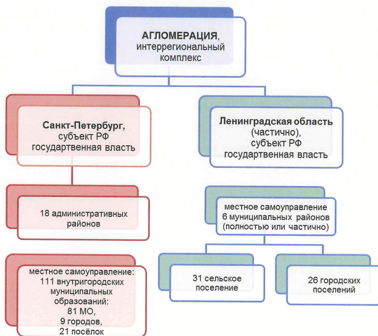
Рисунок 1. Административно-территориальное устройство в границах Санкт-Петербургской агломерации 4 .

В соответствии со «Стратегией социально-экономического развития Санкт-Петербурга до 2035 года» возрастает роль города-миллионника как мощного центра управления, наблюдаются изменения в системе расселения Санкт-Петербурга и быстрое усиление роли его периферийной зоны. «В пределах агломерации Санкт-Петербурга и части территорий Ленинградской области развивается единый рынок труда, фиксируется усиление производственных связей, активизируются кластерные процессы, происходит увеличение масштабов маятниковых миграций» 5 .