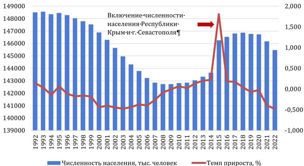
Рисунок 3. Динамика численности населения Российской Федерации на 1 января 1992–2022 гг.

Положительные тенденции роста численности населения России наблюдались с 2010 по 2016 гг. Однако сложившаяся неблагоприятная демографическая конъюнктура, характеризующаяся высоким уровнем старения населения и суженным воспроизводством, сформировала предпосылки для второй волны депопуляции, в которую Россия вошла в 2016–2017 гг. и находится в ней по настоящее время.